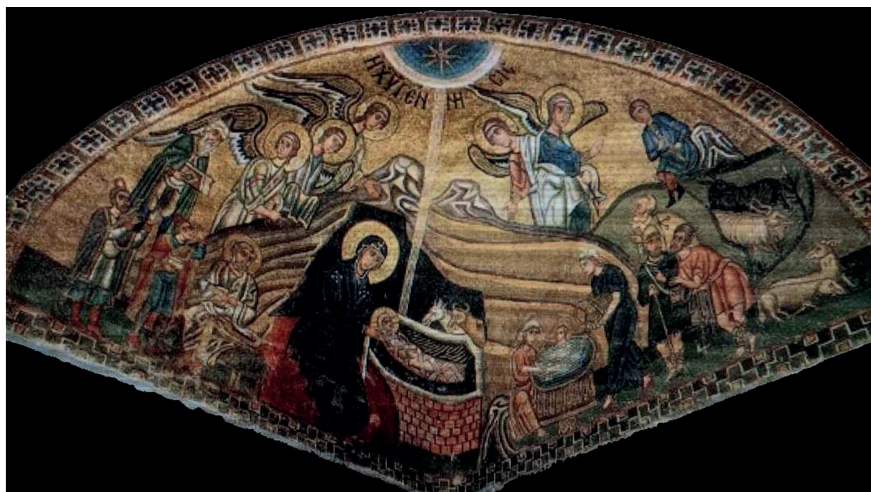
Tav. 9. Monastero di Hosios Loukas, Grecia. Icona a mosaico, sec. XI.