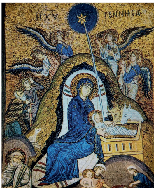
Tav. 10. Palermo, chiesa di Santa Maria dell'Ammiraglio. Icona a mosaico, sec. XII.