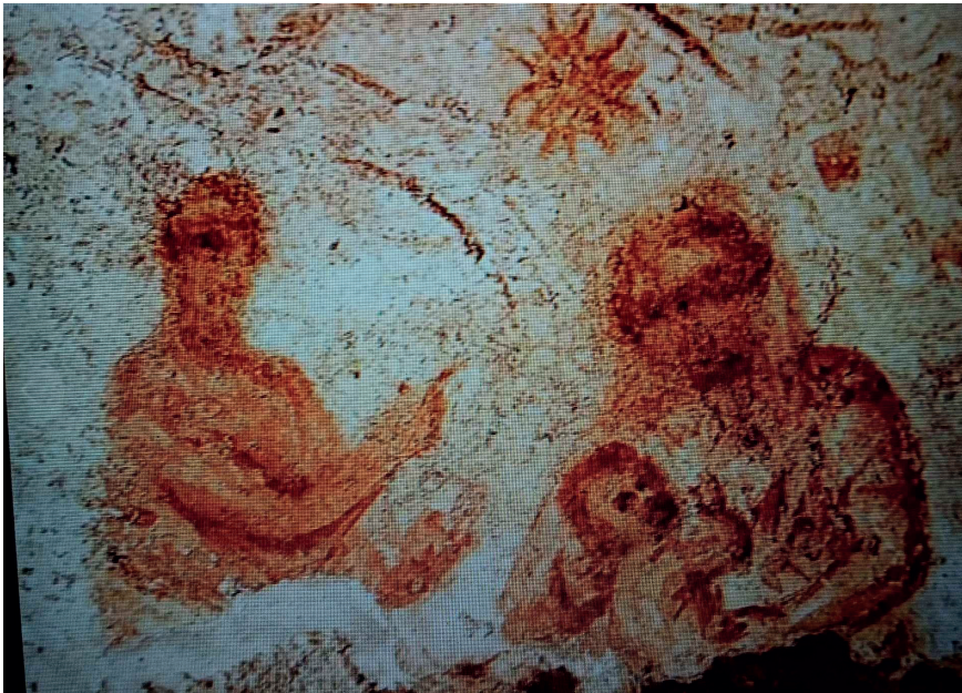
Tav. 8. Roma, nicchia delle catacombe di Priscilla. Pittura murale, III sec.